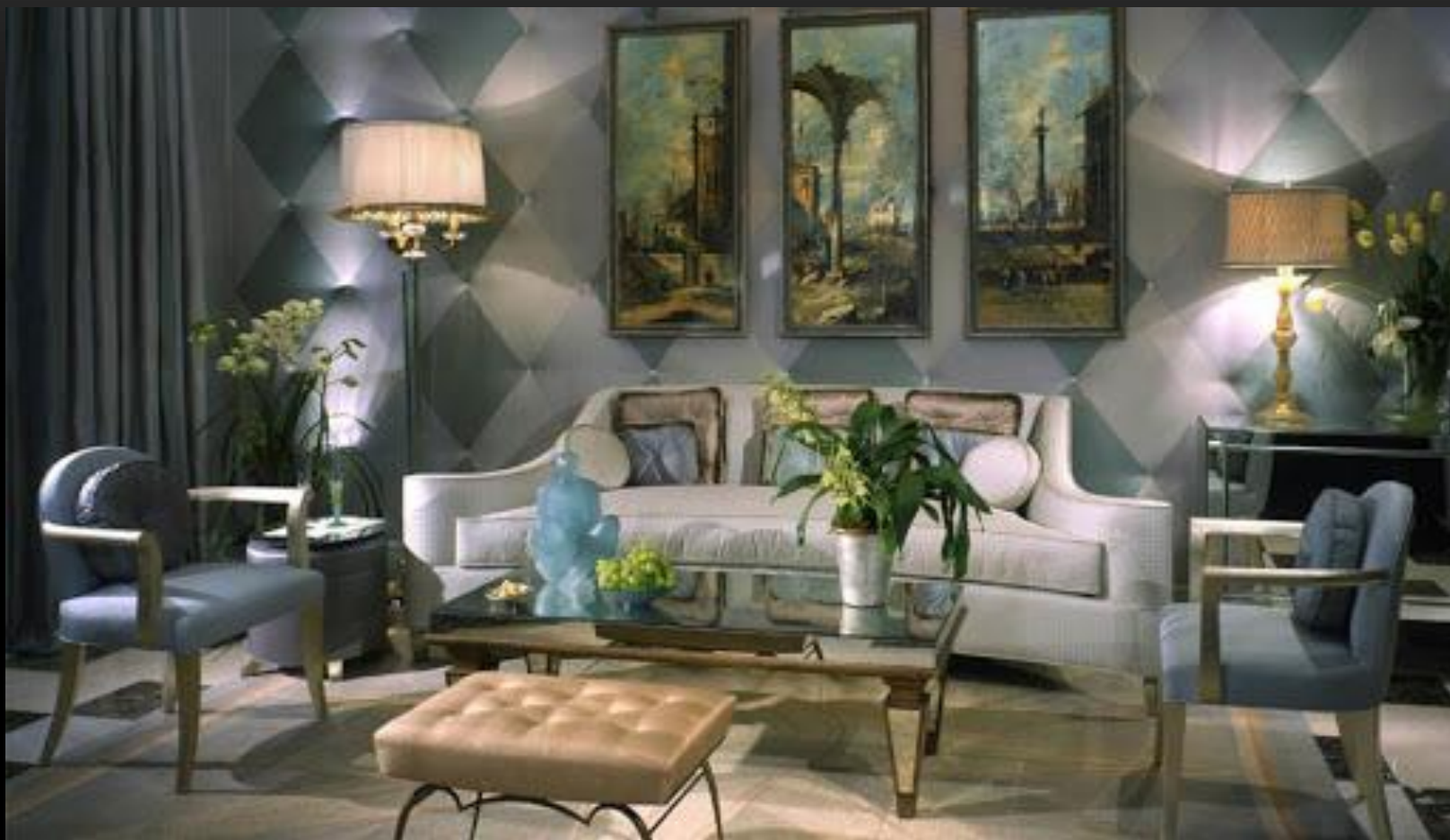
Пример интеръера в стилe арт-деко