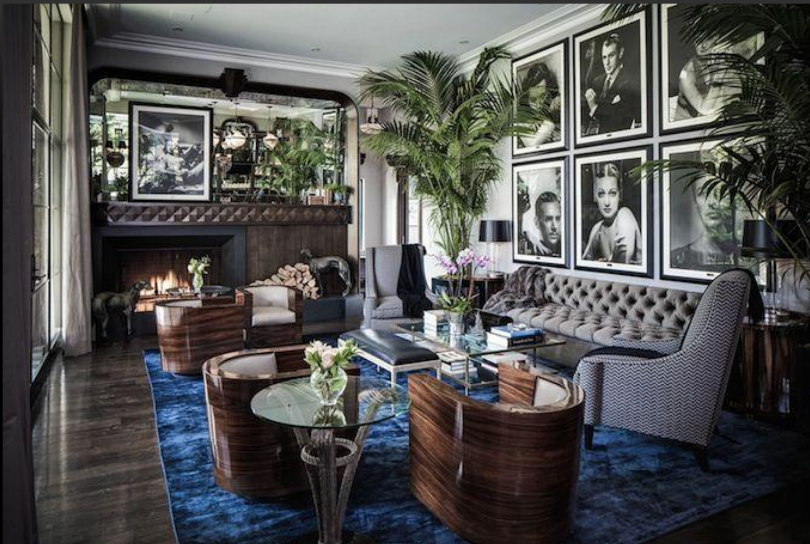
Пример интерьера в стиле арт-деко