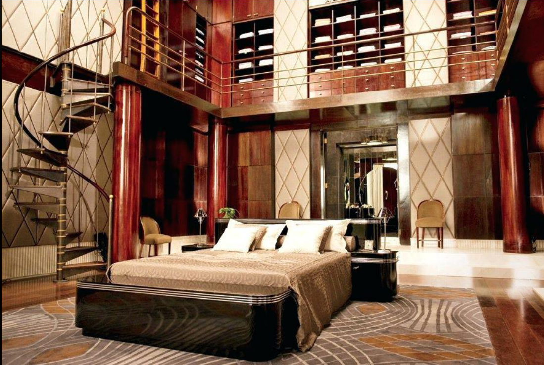
Кадр из фильма "Великий Гэтсби" Спальня в стиле Арт-деко

Стиль арт деко (фр. art deco, досл. «декоративное искусство») или по другому его называют ар деко появился в Париже в 1920-х годах, в период «ревущих двадцатых» — когда Запад восстанавливался от самой крупной на их памяти войны. Для многих стиль ар деко (арт-деко) в интерьере стал символом праздника и желанной свободы.