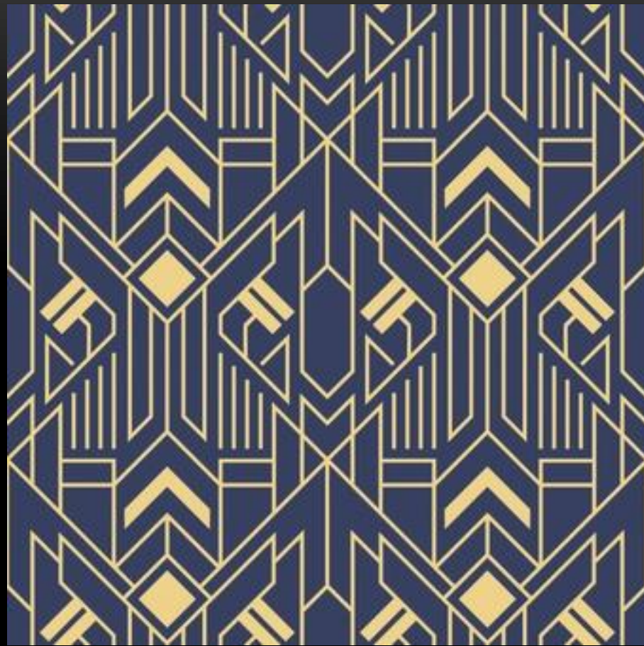
Примеры орнаментов в стиле ар деко