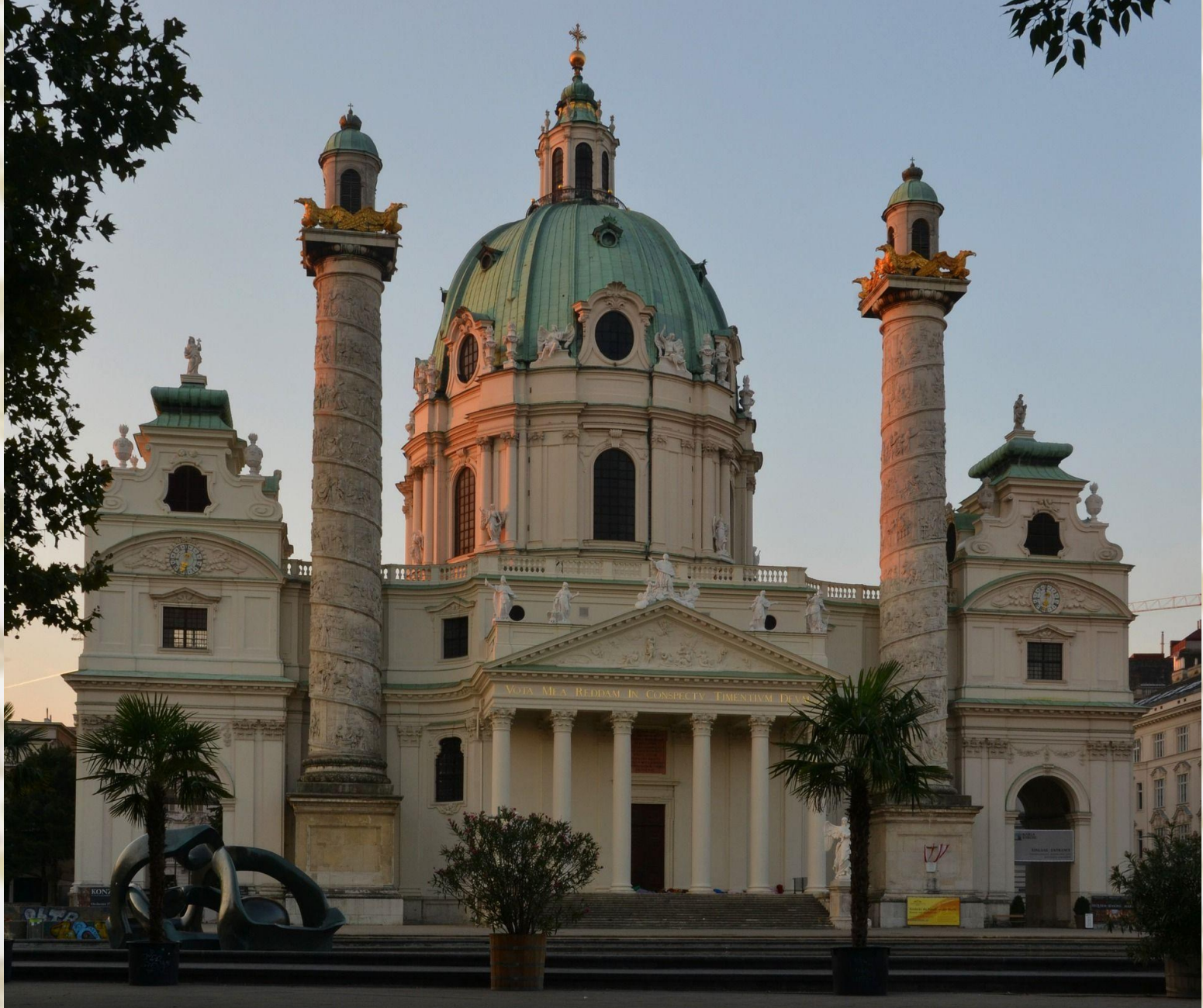
Карлскirche в Вене— выдающийся пример венского барокко. Поверхность фасада слоится, все время прерывается выступами и пилястрами.